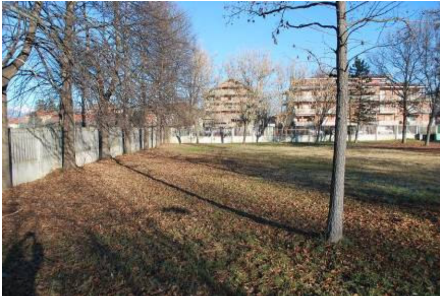
Foto 16 - area libera