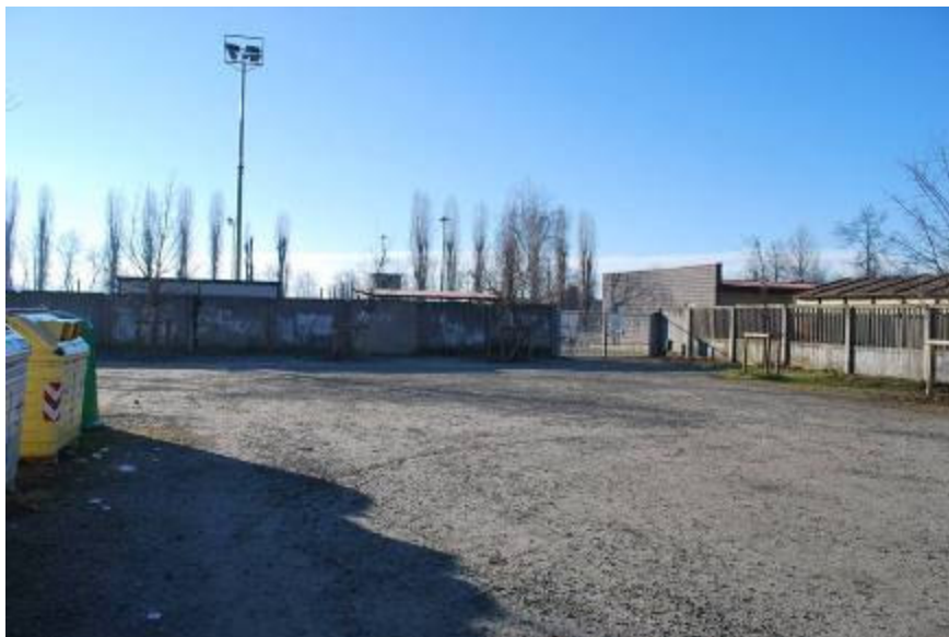
Foto 1 – Area a parcheggio antistante l'ingresso principale agli impianti sportivi