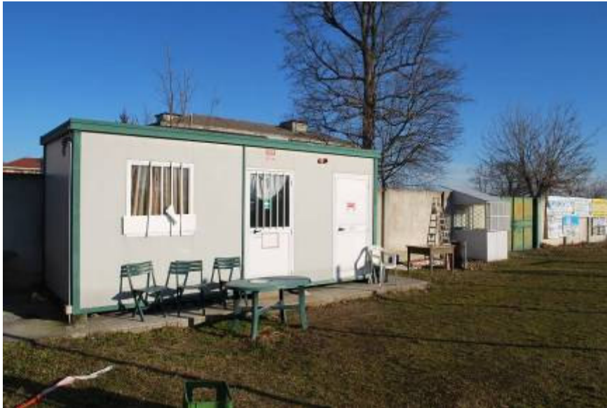
Foto 10 – box prefabbricato e biglietteria area pubblico campo grande "A"