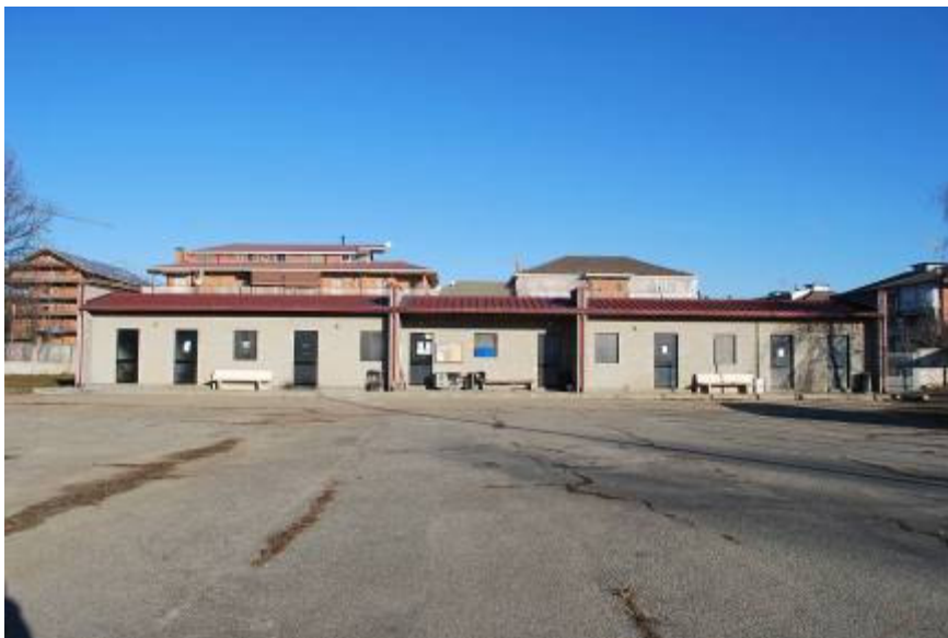
Foto 12 – edificio ospitante spogliatoi, magazzino ed infermeria a servizio impianti sportivi