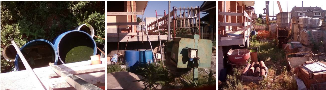
Cantiere di Via Buniva angolo Via Marco Polo a Gerbole, i contenitori pieni di acqua sono stati svuotati e capovolti

In particolare sono stati presi tempestivi provvedimenti in collaborazione con l'Ufficio Ambiente del Comune per il cantiere in frazione Gerbole che presentava diversi focolai attivi nei contenitori e materiali lasciati nel cantiere da lungo tempo fermo: