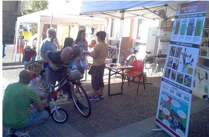
14 luglio 2016, Stand in Via Ponsati

In occasione della festa patronale del 14 luglio, è stato predisposto uno stand nello spazio davanti al Comune. Durante la serata sono stati distribuiti circa 175 volantini con allegato l'invito per la serata informativa aperta ai cittadini, fissata per il 22 luglio. Allo stand si sono fermate numerose persone interessate e sensibili al problema a cui sono state fornite alcune nozioni sul ciclo biologico della zanzara e sui metodi per il contrasto.