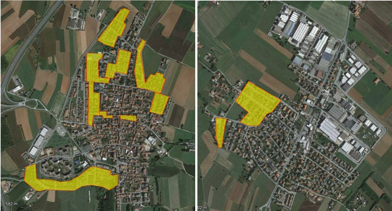
Attività di porta a porta a Volvera e a Gerbole

I volantini sono stati consegnati con attività di porta a porta nelle zone qui sotto evidenziate, per un totale di 275 volantini: