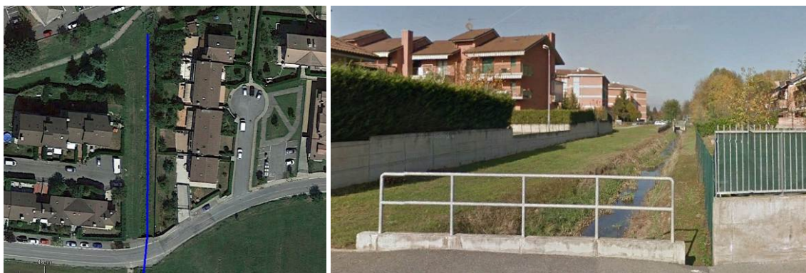
Trattamenti focolai extraurbani