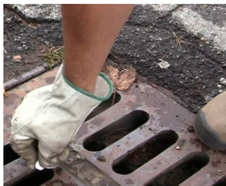
Trattamenti nelle caditoie stradale

Il Cimitero di Volvera è stato trattato dal Tecnico di Campo come segue: