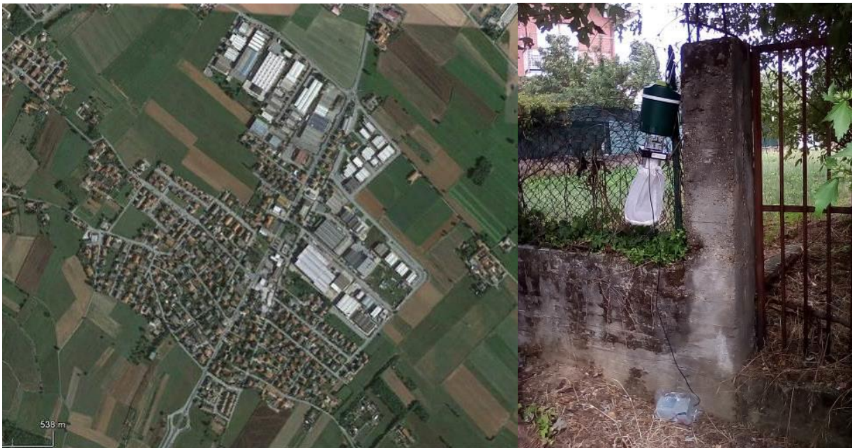
Trappola attrattiva innescata con ghiaccio secco e sua ubicazione a Gerbole di Volvera